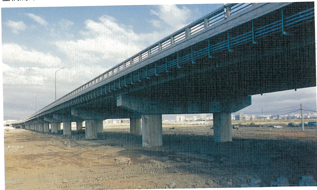
台一線跨越二重疏洪道高架橋——重新大橋