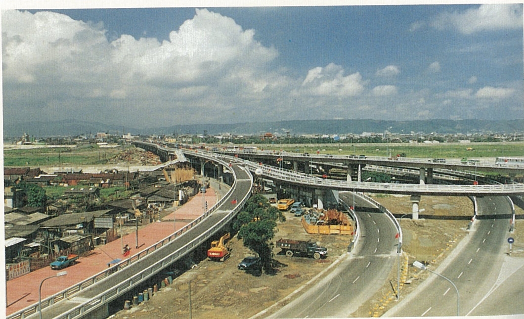
遠眺三重端匝道橋